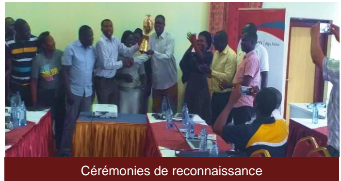
Cérémonies de reconnaissance

Dans le comté de Migori, des prix sont remis aux membres les plus performants du personnel sanitaire, sur la base de l'indicateur de la carte de score SRMNIA et d'autres améliorations des taux de couverture des services.