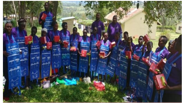
Distributeurs communautaires formés à la planification familiale

Le comté de Kuria East a fait preuve d'un engagement politique exemplaire à la suite de l'adoption de la carte de score SRMNIA. Les membres de l'assemblée du comté assistent souvent aux réunions d'évaluation du comté ou du sous-comté. Un forum de plaidoyer destiné aux membres de l'assemblée du comté est aussi organisé chaque trimestre avec l'appui de partenaires (Fondation Bill et Melinda Gates, Projet TCI de planification familiale et UN Health Six coalition) pour fournir aux législateurs les cartes de score SRMNIA et d'autres données utiles pour la planification et la prise de décisions politiques. Après avoir consulté la carte de