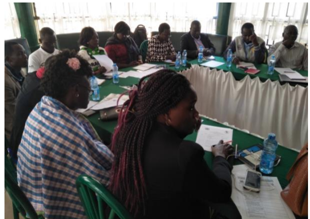
Forum de plaidoyer avec les membres de l'assemblée du comté